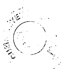
Umut ORAN İstanbul Milletvekili