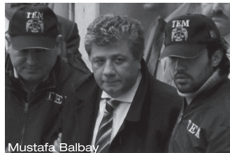
Mustafa Balbay Member of the parliament, journalist under costady for more than 1000 days

Members of the government defend this situation by saying that “none of the journalist are in prison because of their journalistic activities.” In various cases government officials describe the journalists under custody as terrorists despite the fact that the long periods of the trial is a breach of the basic human right and according to the 6th Article of the European Convention of Human Rights states “Everyone charged with a criminal offence shall be presumed innocent until proved guilty according to law.”